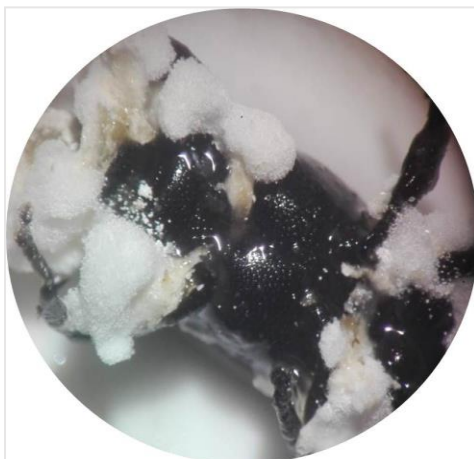
Figura 2. Cosmopolites sordidus infectados con diferentes concentraciones de la cepa B. bassiana 12H

Los promedios de mortalidad de la plaga estudiada según la cepa y concentración empleadas demostraron estadísticamente que para cada cepa utilizada control y BI12H existió diferencias significativas con respecto al tiempo en días empleado en el presente trabajo, lo cual nos permitió reafirmar una regla directamente proporcional donde al aumentar el tiempo de acción de las cepas entomopatógenas, incrementó el promedio de muertos infectados para la plaga Spodoptera frugiperda .