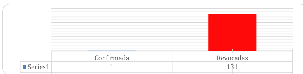
Figura 2: Tratamiento en el proceso contencioso administrativo de los procesos iniciados por los profesores de la Unidad de Gestión Educativa Local – San Martín, 2018

Interpretación: en el gráfico se puede observar que, 131 sentencias de vista, expedidas por la Sala Civil Descentralizada de Tarapoto de la Corte Superior de Justicia de San Martín, revoca la sentencia que declara fundada la demanda sobre pago de la bonificación especial por preparación de clases en primera instancia, significando ello el cambio de la decisión primigenia en la cual se declararon fundadas. Asimismo, puede apreciarse que solo una sentencia fue declarada fundada en primera instancia y confirmada por la Sala Civil Descentralizada de Tarapoto.